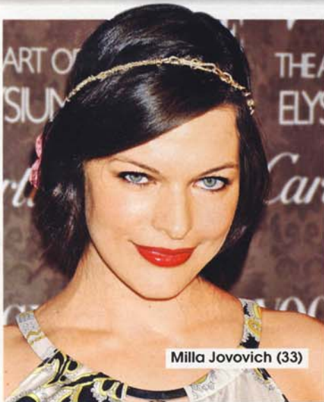
Milla Jovovich (33)

Neue Romantik Mit Kristallen besetzt und von Mischa Barton design, um 68 Euro (www.stacey lapidus.com).